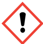
Exclamation mark Harmful/irritant Harmful to ozone layer