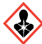
Health hazard Severe health hazards