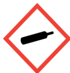
Gas cylinder Gases under pressure