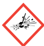
Exploding bomb Explosives