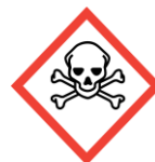
Skull and crossbones Acute toxicity