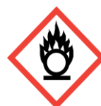
Flame over circle Oxidisers