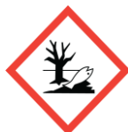
Environment Environmental hazard